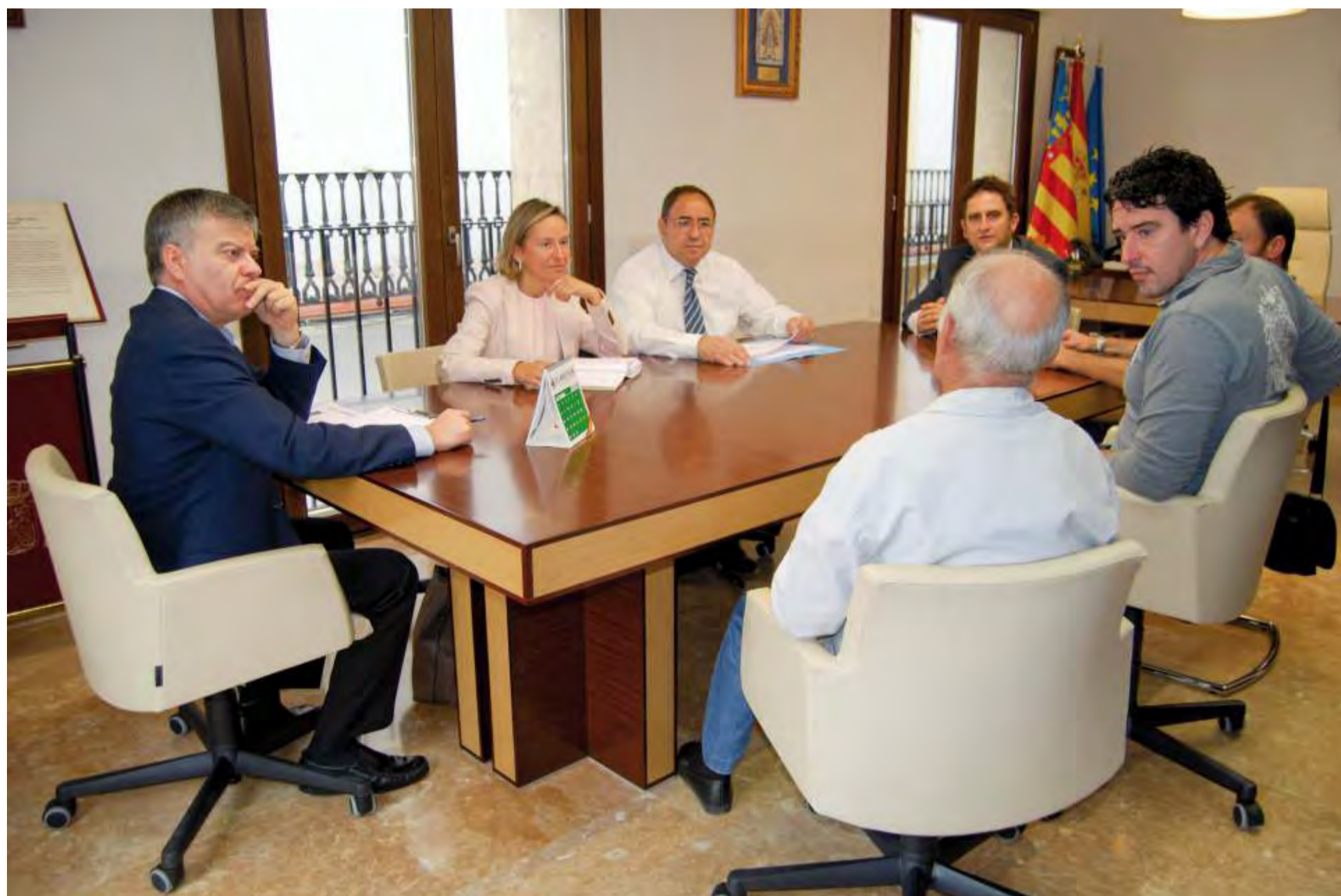
Visita delegación Consell