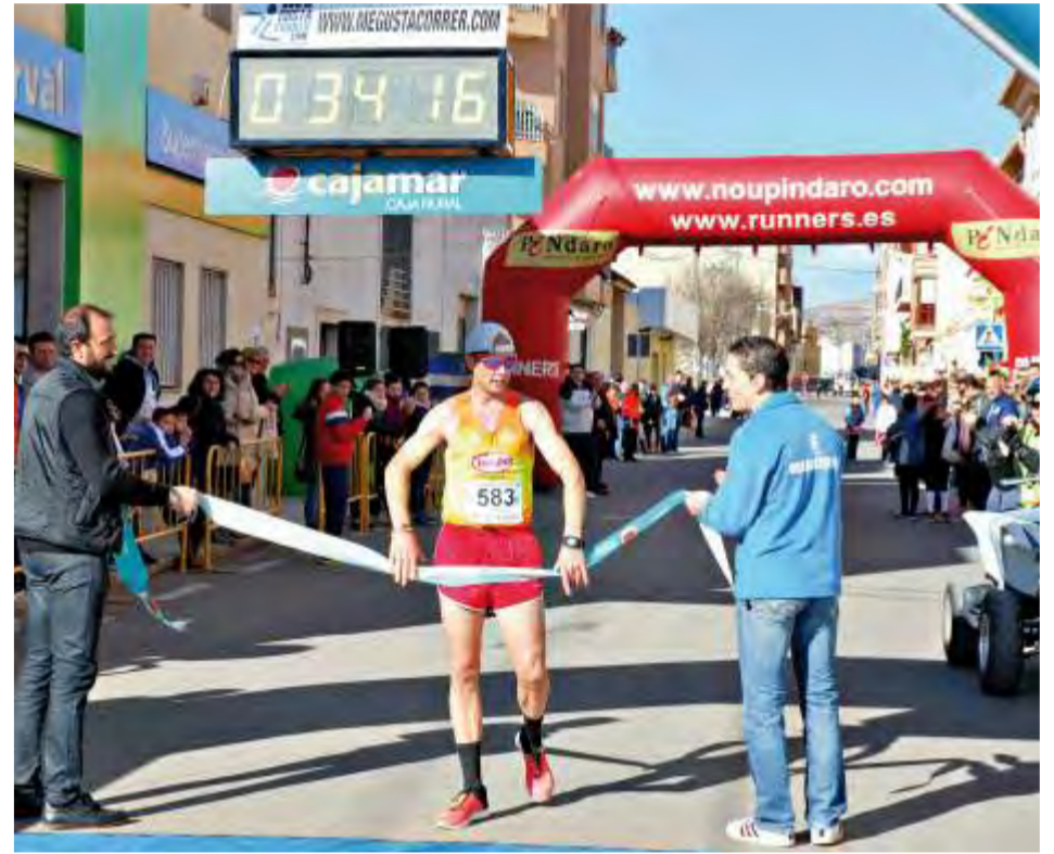
Carrera parque natural del Túria