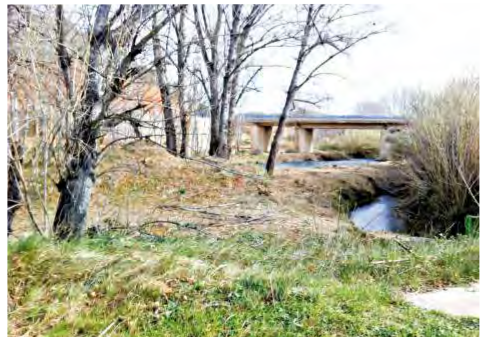
Limpieza barrancos y ríos