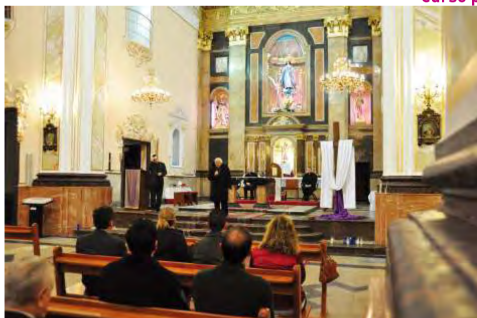
Visita Arzobispo D. Antonio Cañizares