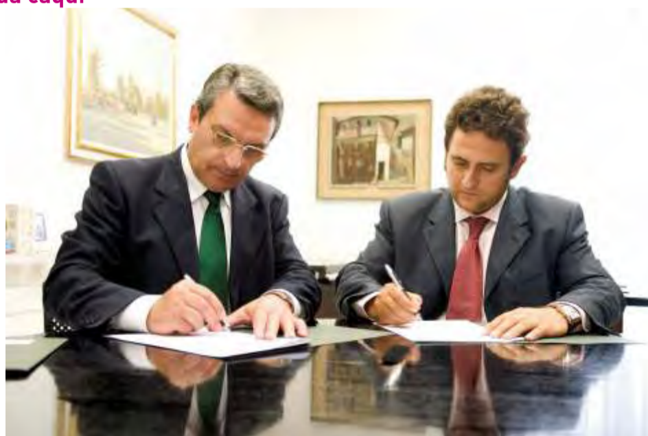
Firma convenio turismo