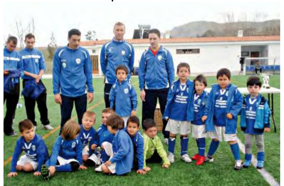
Torneo futbol base pascua