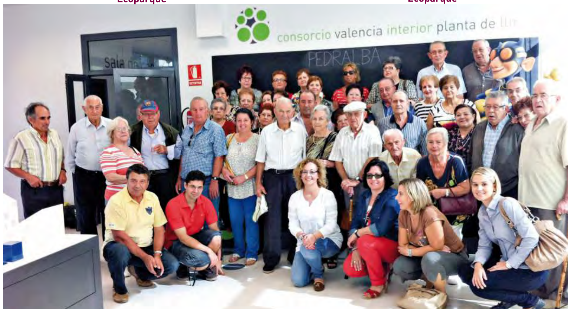
Visita planta transferencia de Llíria