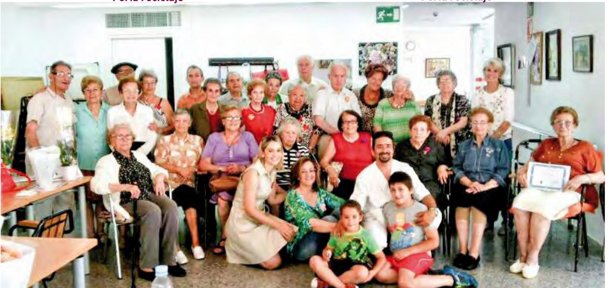
Aula de respiro