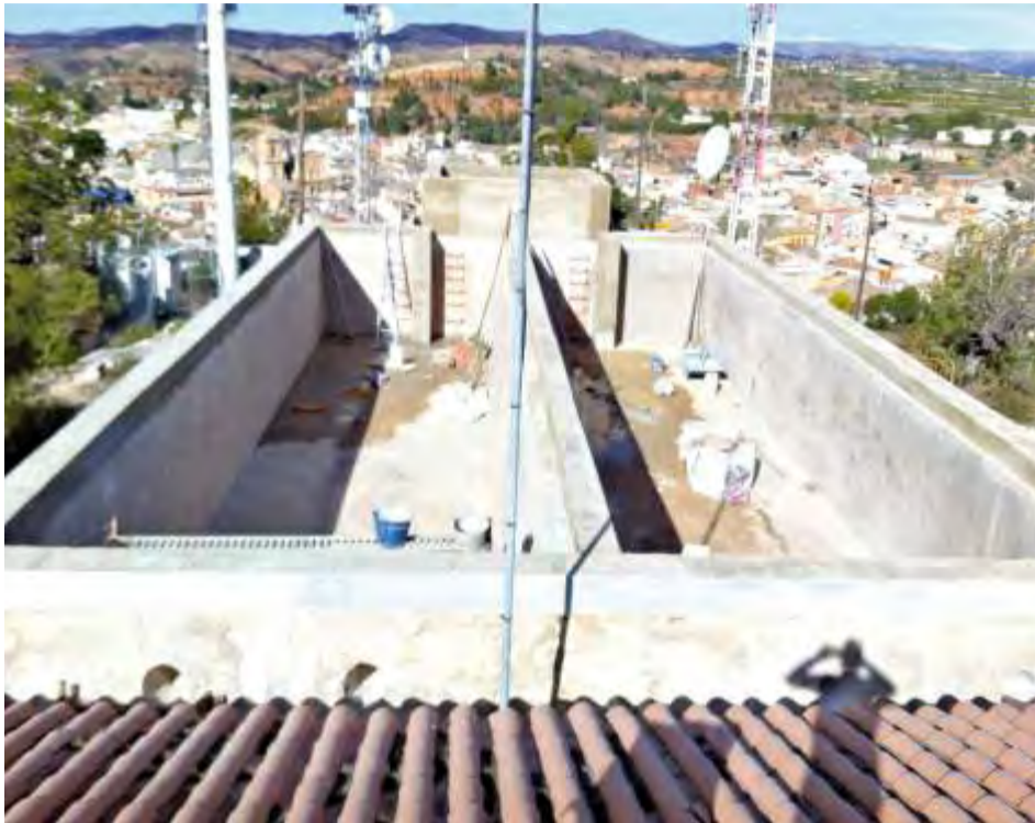
Depósitos ermita agua potable