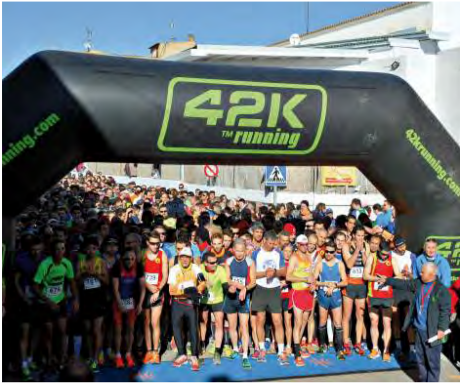
Carrera parque natural del Túria