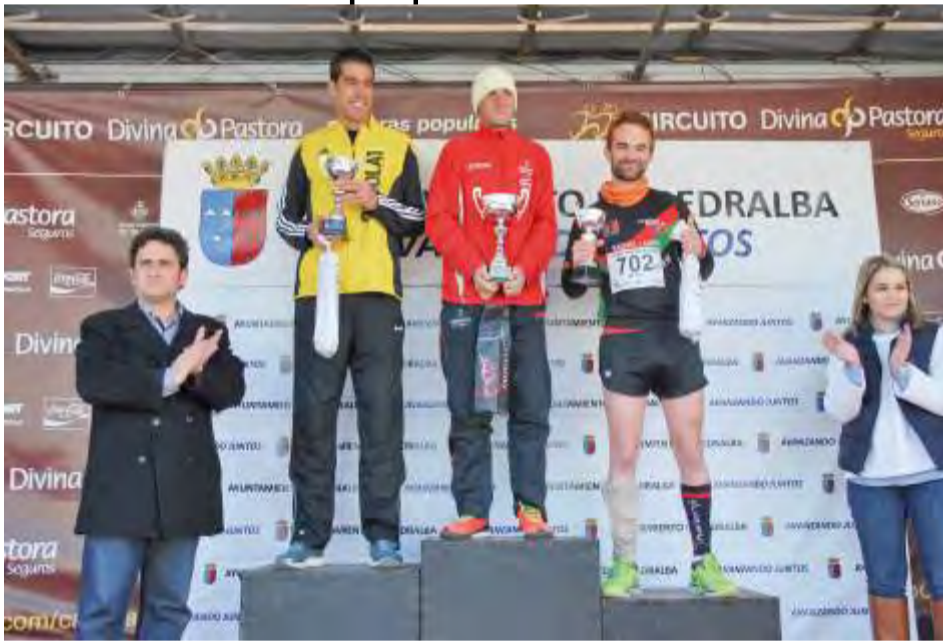
Entrega premios carrera parque natural del Túria