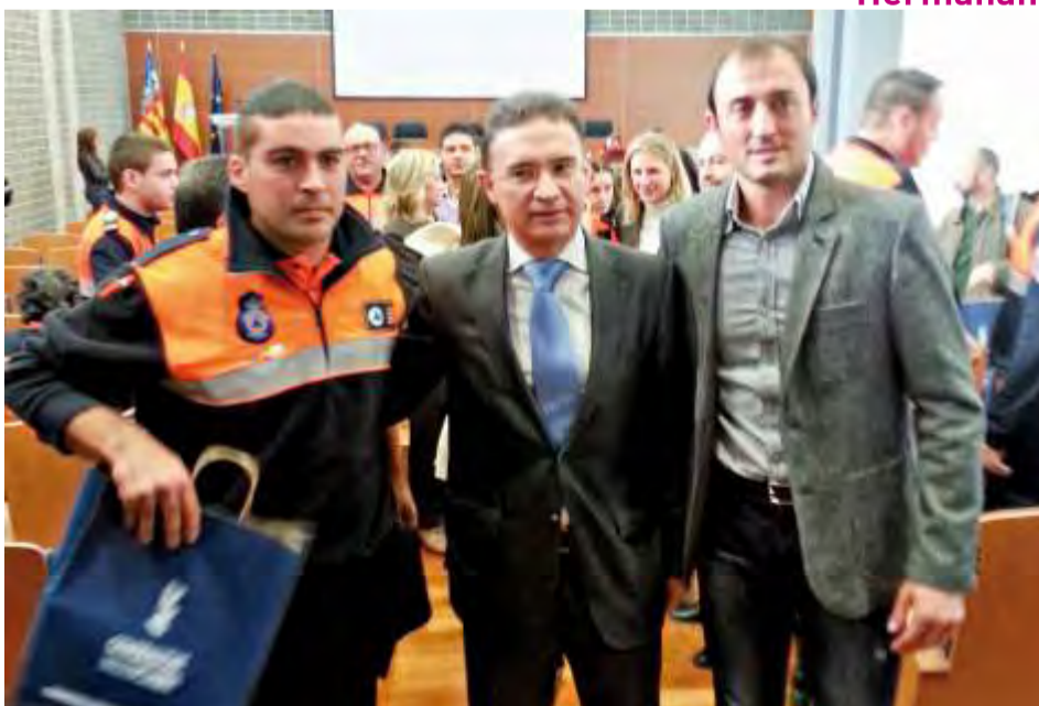
Entrega emisoras Protección Civil