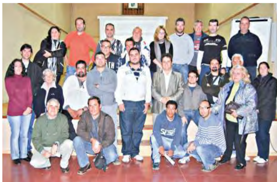
Curso agricultura ecológica