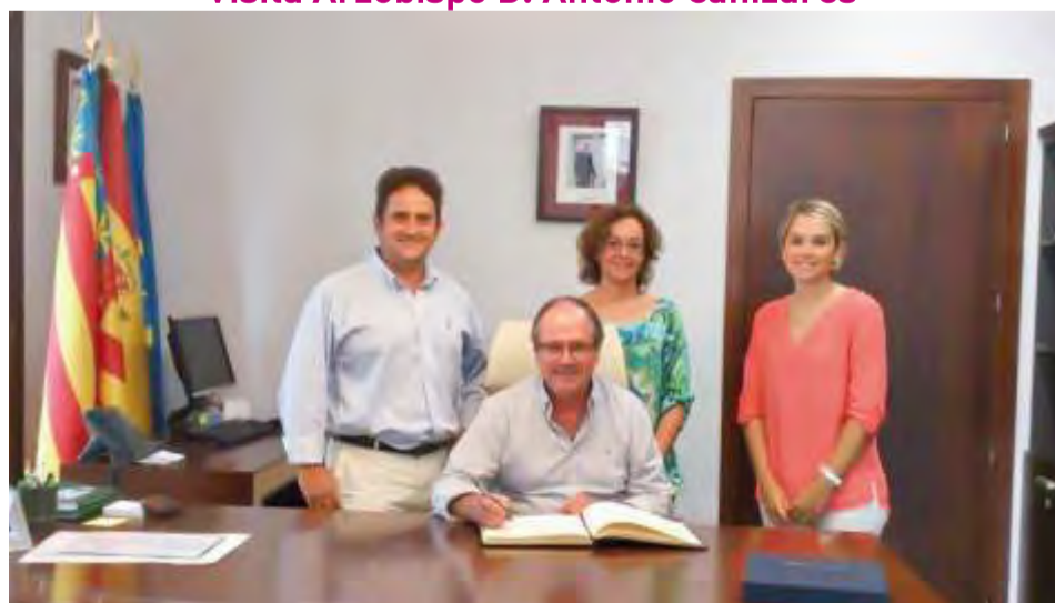
Firma convenio la Dipu te beca