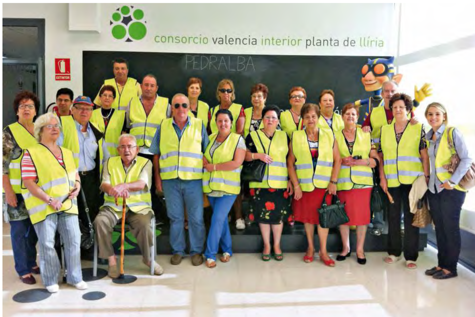
Visita planta transferencia de Lliria