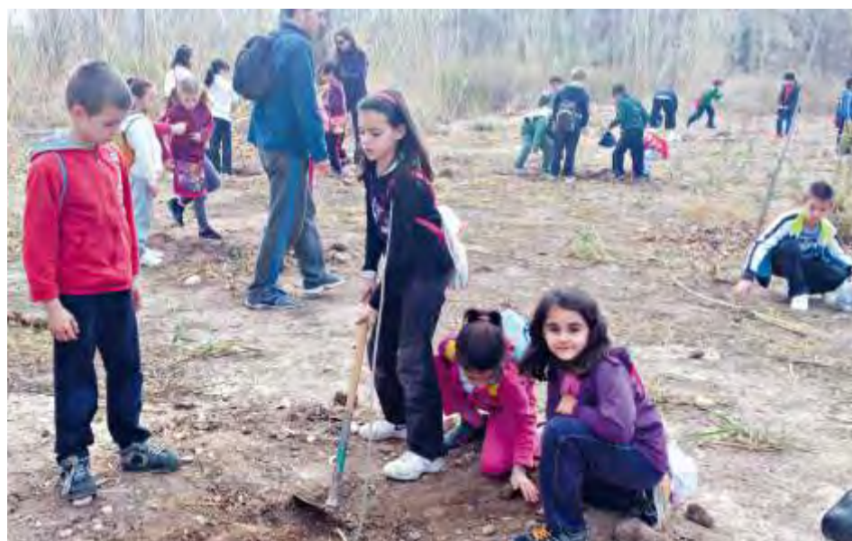
Día del árbol