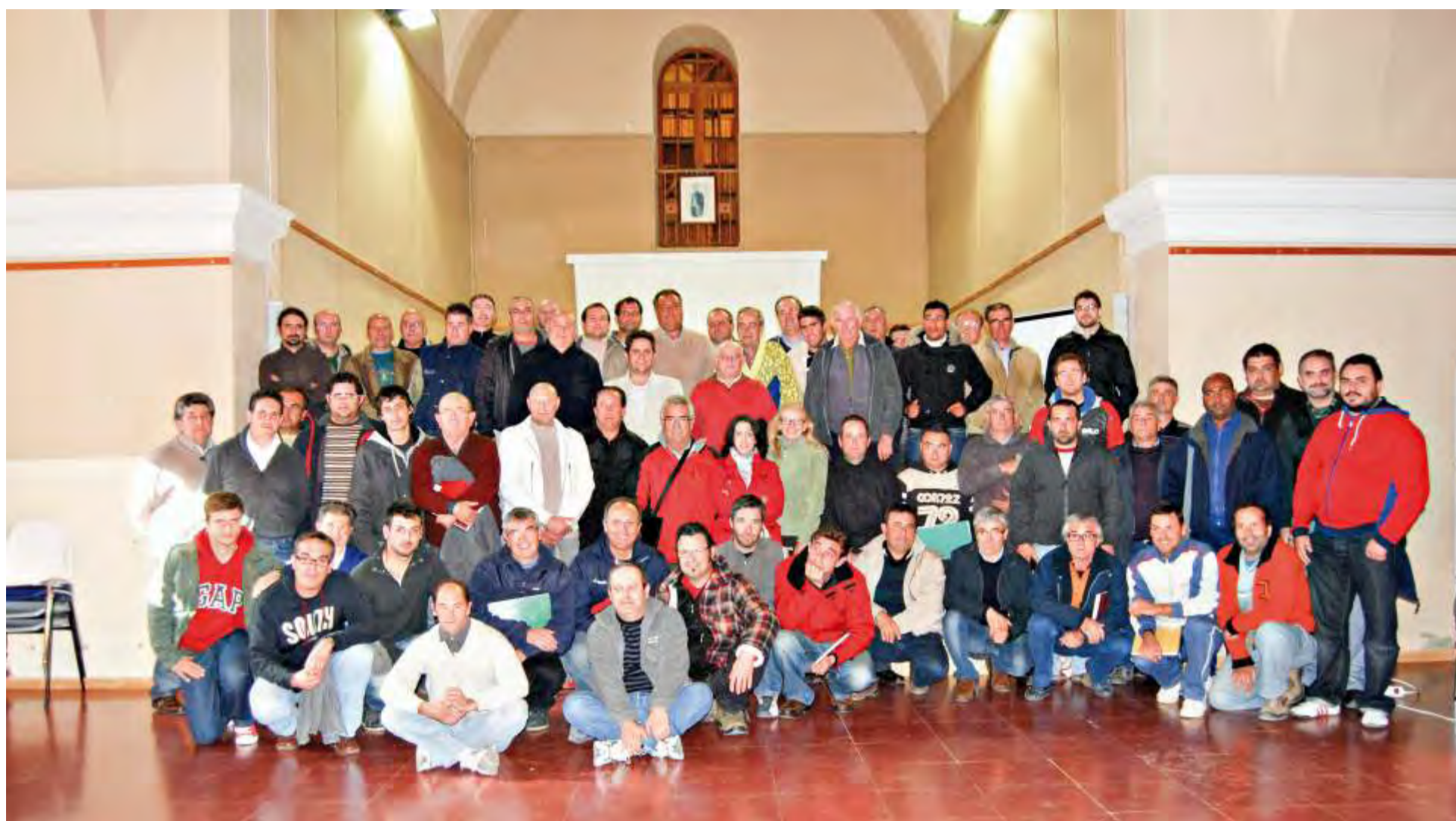
Curso poda caqui