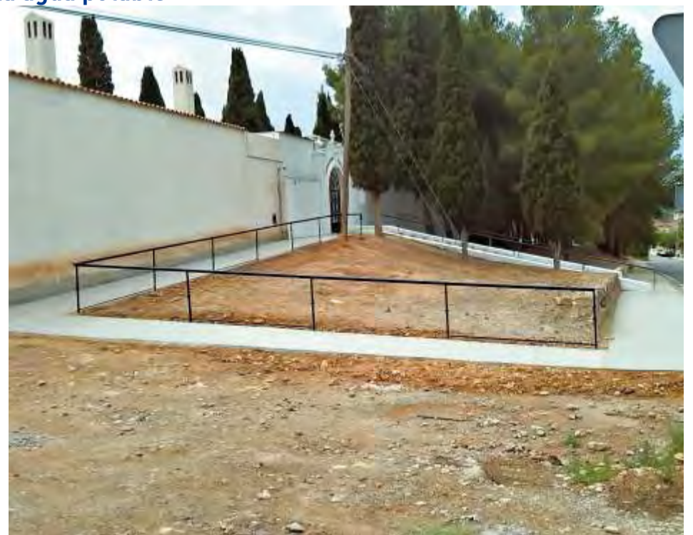
Mejoras acceso cementerio