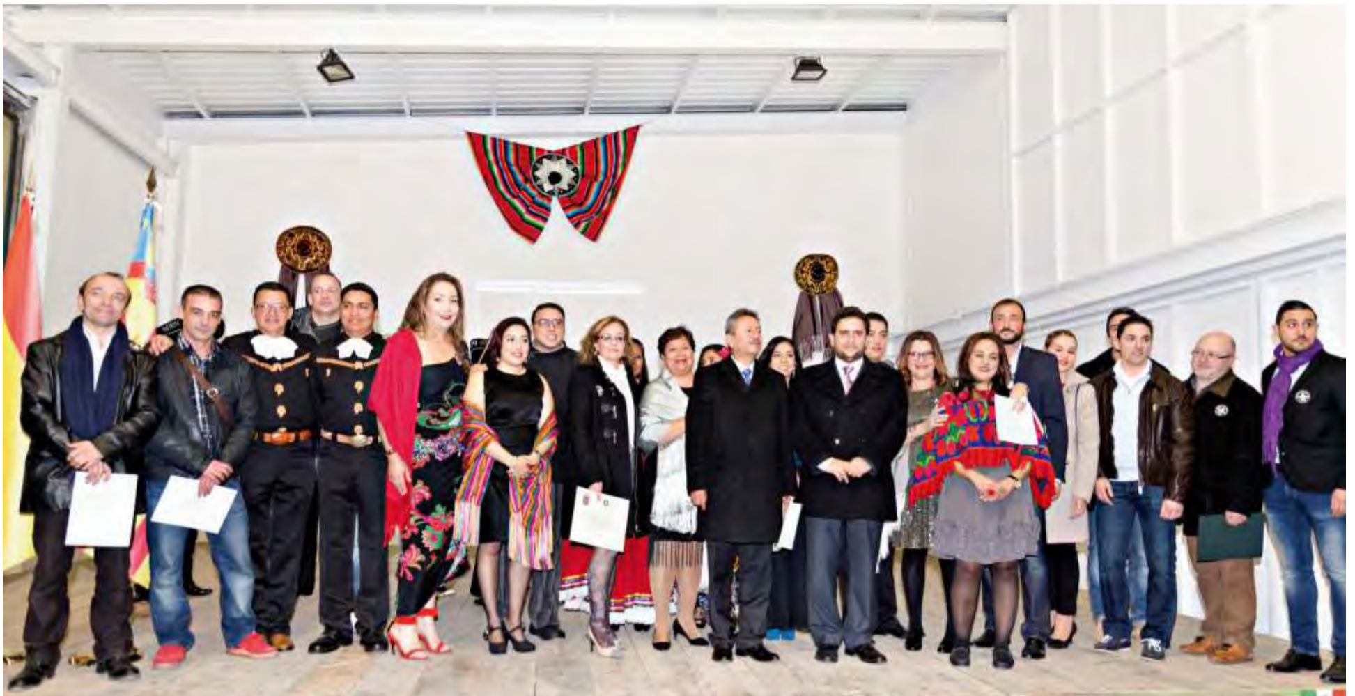
Encuentro Hispano - Mejicano