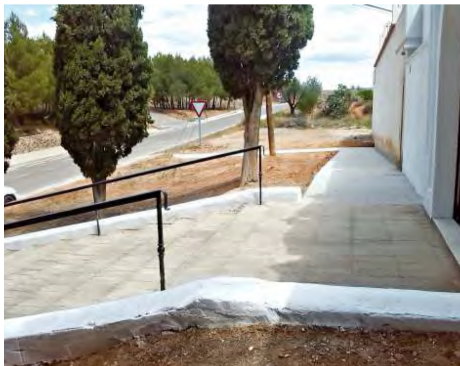
Mejoras acceso cementerio