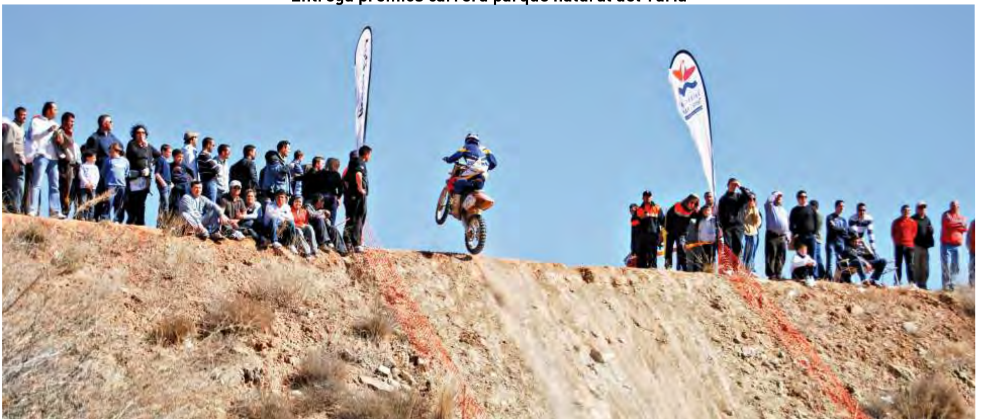
Carrera resistencia enduro