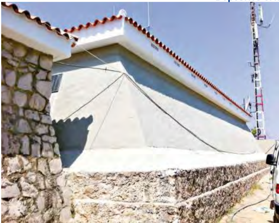
Depósitos ermita agua potable