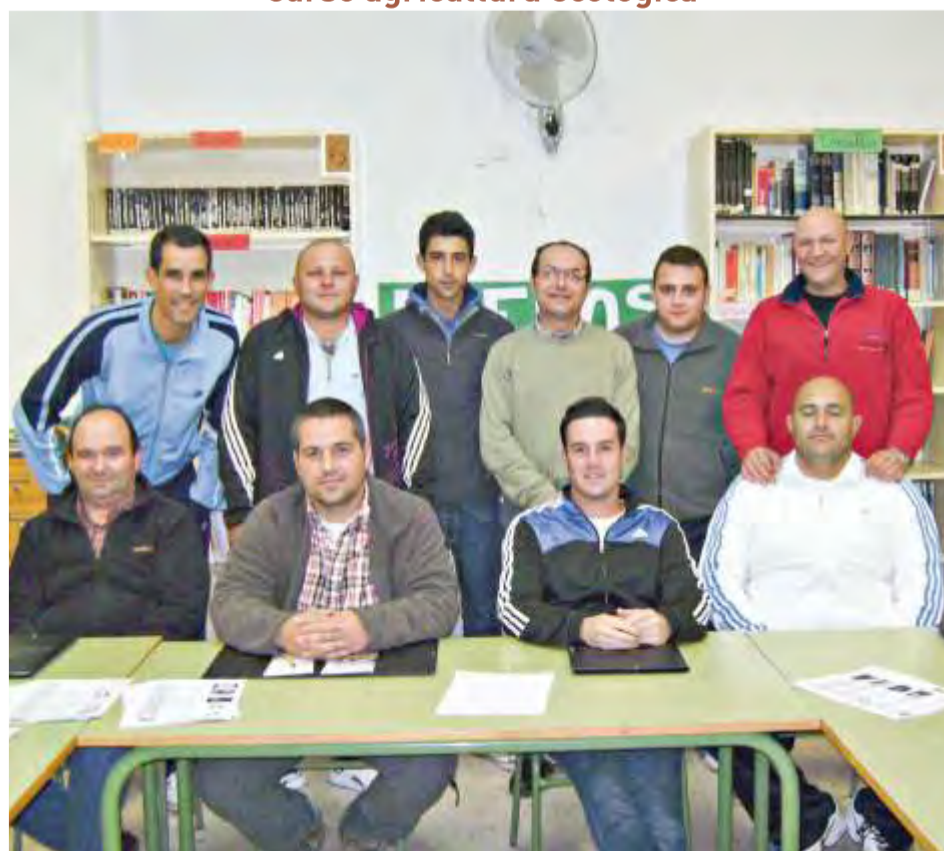
Curso conducción de camiones