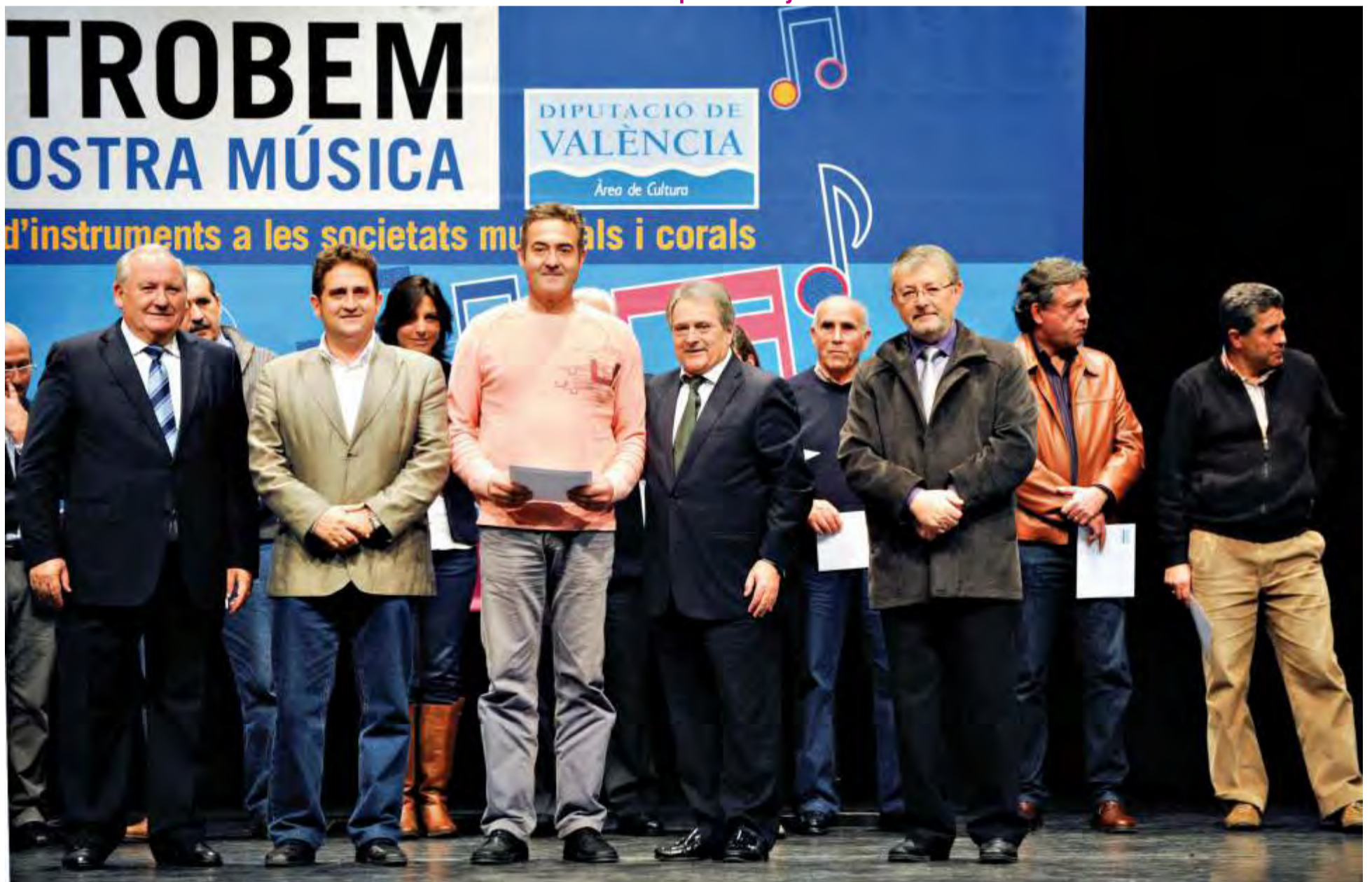
Entrega de instrumentos musicales