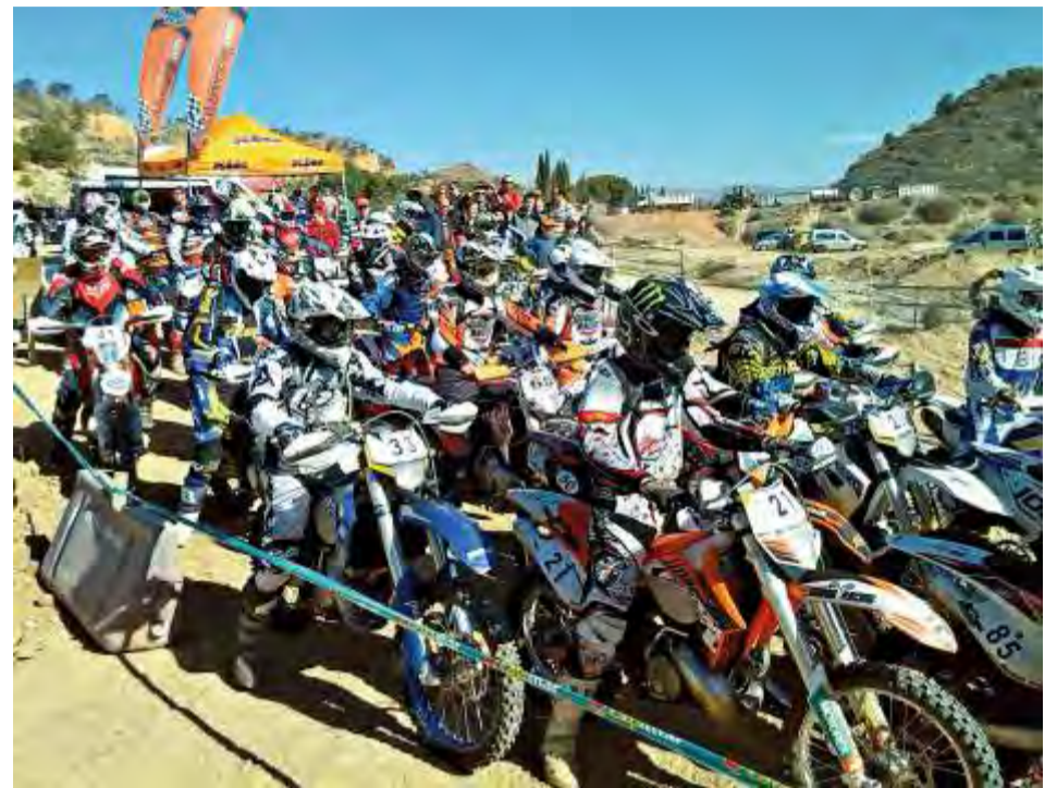
Carrera resistencia enduro